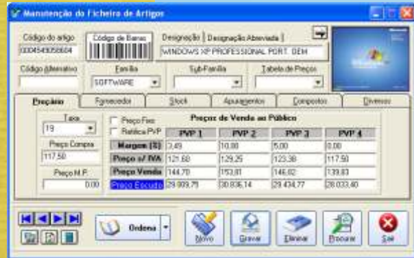
Artigos compostos, específicos para papelarias e serviços