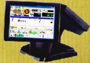
Módulo de Pontos