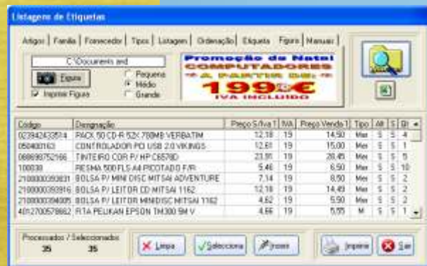
Impressão de etiquetas automática e programável